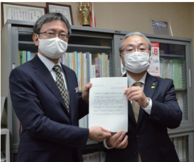
(左から) 県くらし保健福祉・房村部長、久木元会長