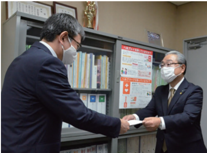
久木元会長から県くらし保健福祉部長へ要望書を提出

今後も全国経営協と連携しながら、社会福祉法人があらゆる社会課題の解決に取り組む姿を発信するとともに、しっかりとしたエビデンスをもって県などに対して要望を届けるとともに、会員法人へ有益な情報を提供できるよう努めてまいります。